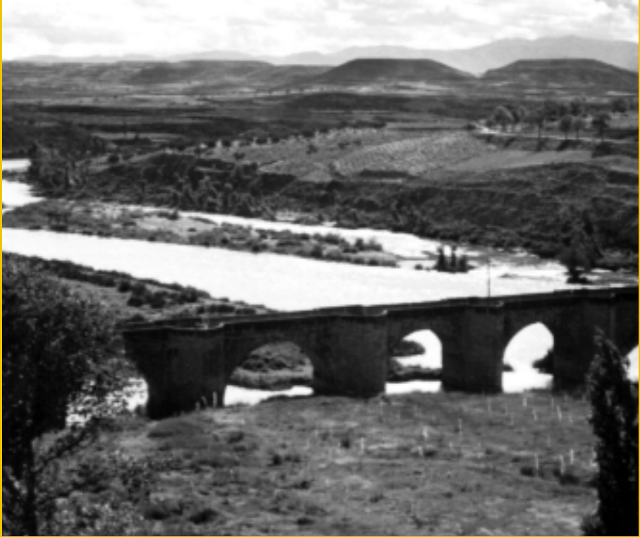
▲ 1960 Ebro ibaia.