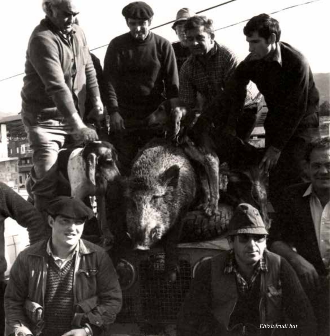
Ehiza irudi bat