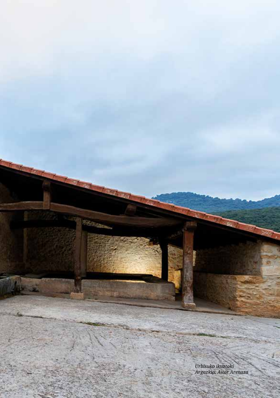
Urbisuko ikuztoki