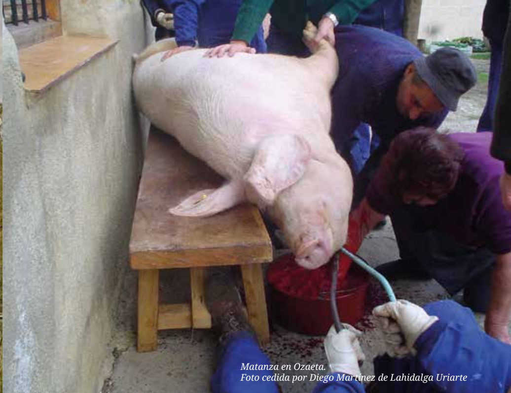
Matanza en Ozaeta.