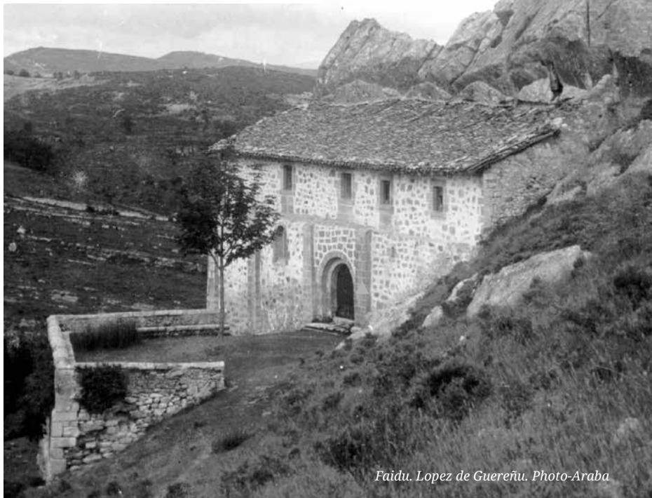
Faidu. Lopez de Guereñu. Photo-Araba

Faidu herriaren goialdean, eskuz egindako haitzulo mordo bat dago, Arabako handiena eta zirrargarriena. VI-XI. mendeen artean bizitoki izan ziren; hasieran lau estai edo mailakoak ei ziren, eta bertan idazkunak, hilobiak, eta horma-irudi harpetarrak aurkitu dira. Batean, Peñako Andere Mariaren basiliza eraiki zen, Euskadiko Monumentu Nazional izendatua, Euskal Herrian dagoen basilizarik zaharrena delakoan. Hemen dena harrigarri da, alde batetik sarguko ar-