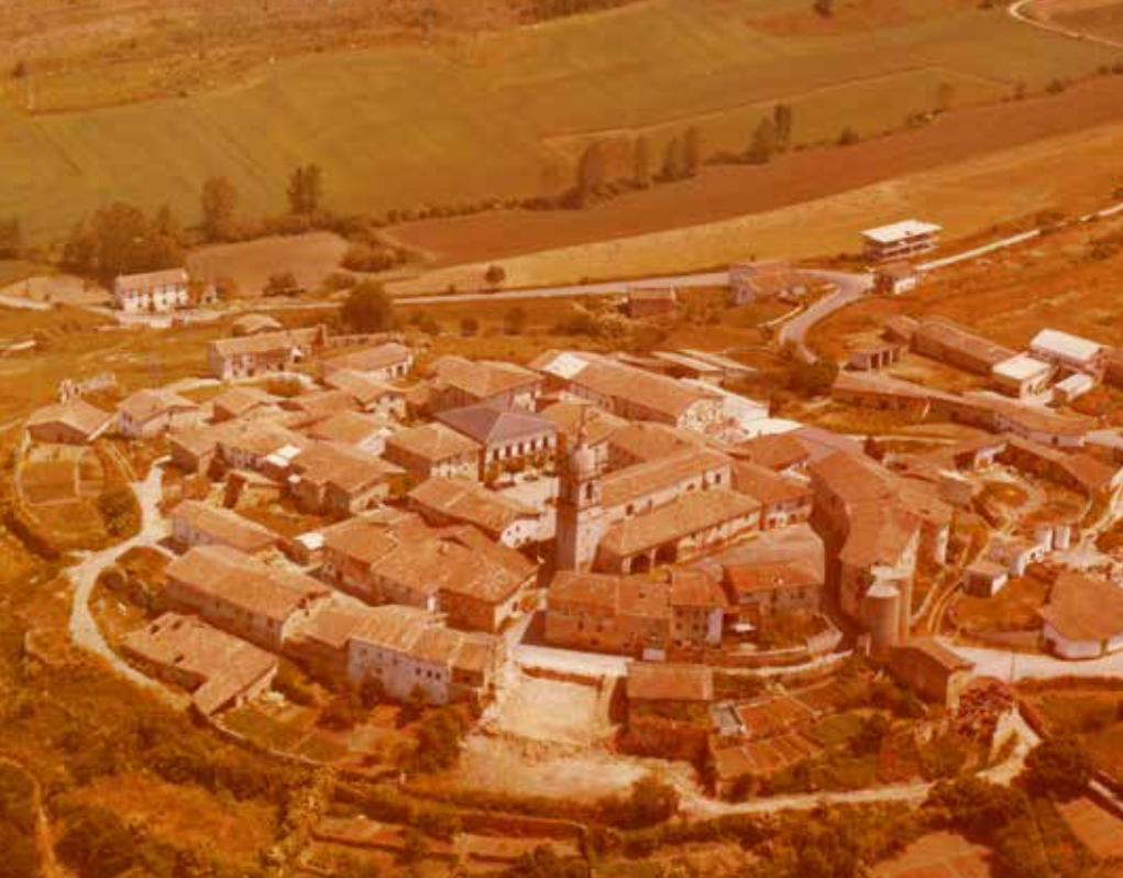
Urizaharra gainetik ikusia